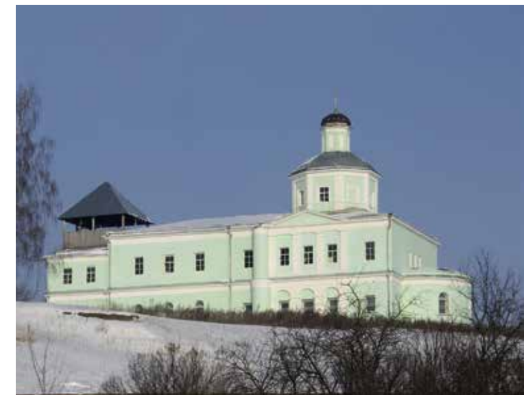
Сергиевский храм с. Горы

Каждый из них вносил свой вклад в формирование культурного наследия села. В селе были построены два храма: Введения во храм Пресвятой Богородицы и Сергиевский. Каждый из них имеет свою историю.