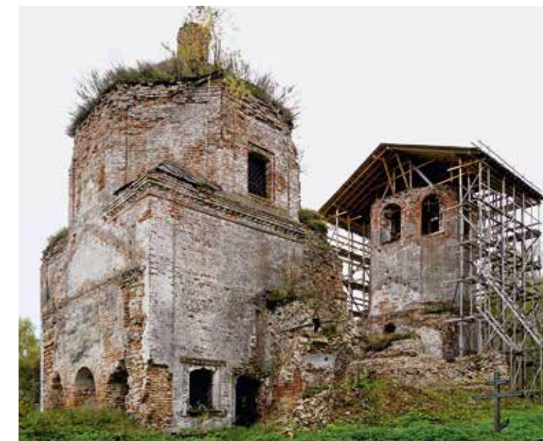
Христорождественский храм с. Ильинское Наро-Фоминского р-на