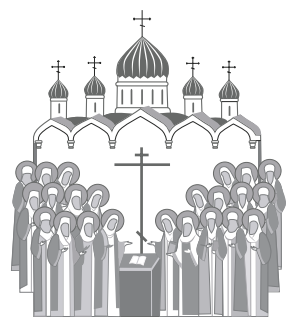
ПОЧИТАНИЕ НОВОМУЧЕНИКОВ И ИСПОВЕДНИКОВ