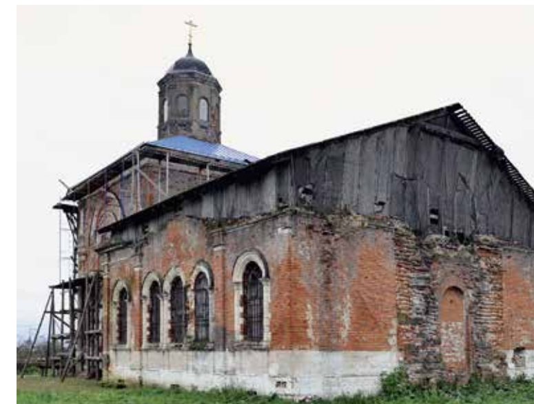
Покровский храм с. Нововасильевское Лотошинского р-на